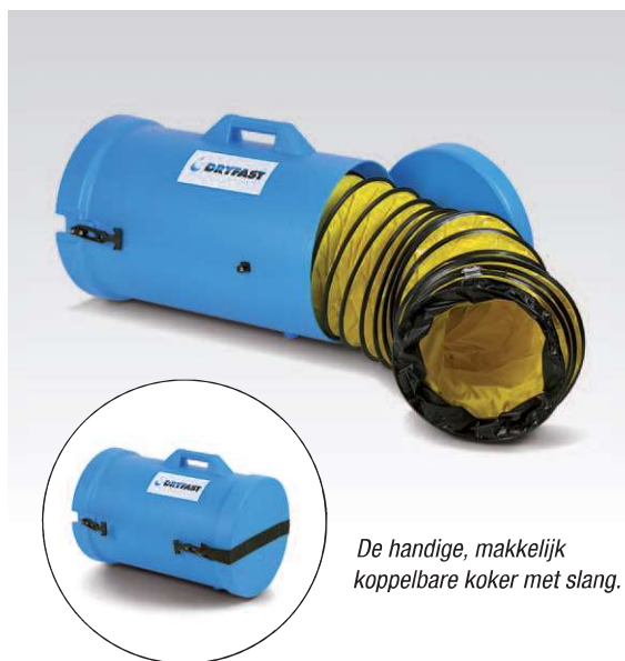
De handige, makkelijk koppelbare koker met slang.